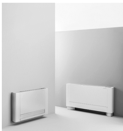
【住宅用ファンコイルユニット】