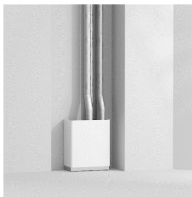
【全熱交換換気システム】