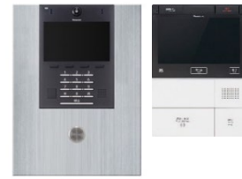
ロビーインターホン 親機

来訪者の用件が呼出音と交互に、繰り返し鳴動するため聞き逃しもなく安心して来客応対ができます。