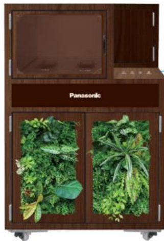
▲高速自動ボトル洗浄機