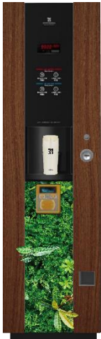
▲本実証実験用のセブンカフェ自販機

真空断熱構造で美味しいコーヒーを「長時間保温・保冷」でき「結露の心配がない」、さらに密閉構造のフタで「安心して持ち運べる」ボトルを活用するとともに、マイボトル利用に対する心理的ハードルの1つである洗浄の手間を「高速自動ボトル洗浄機にセットするだけ」という手軽さで軽減することによって、オフィスでのマイボトル活用を促進し、一人ひとりが無理なくオフィス内廃棄物の削減を実現できる環境の構築を目指します。