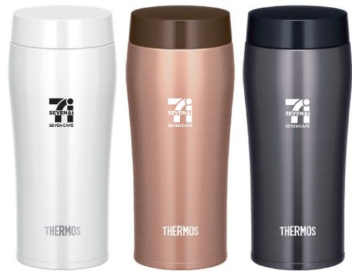
▲実証に用いるマイボトル (実証実験向けオリジナルデザイン、非売品)