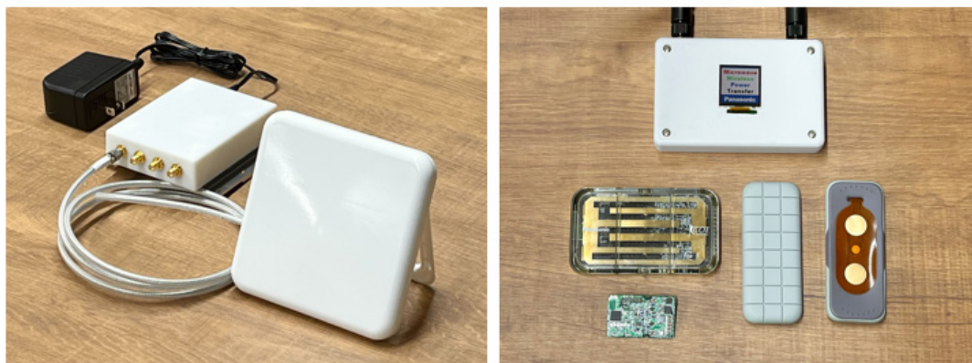
(左)送電機、(右)各種受電機

今回、パナソニックは、京都大学と開発した技術を組み込んだプロトタイプシステムを製作しました。このシステムは、1ワット出力の送電機と、カードタイプ、人体装着タイプ、液晶表示タイプ、基板タイプなどの様々な形態の受電機から構成されており、準備が整い次第、サンプル提供を開始する予定です。このシステムを活用し、様々な用途・シーンでの試験的活用を進めていきたいと考えています。