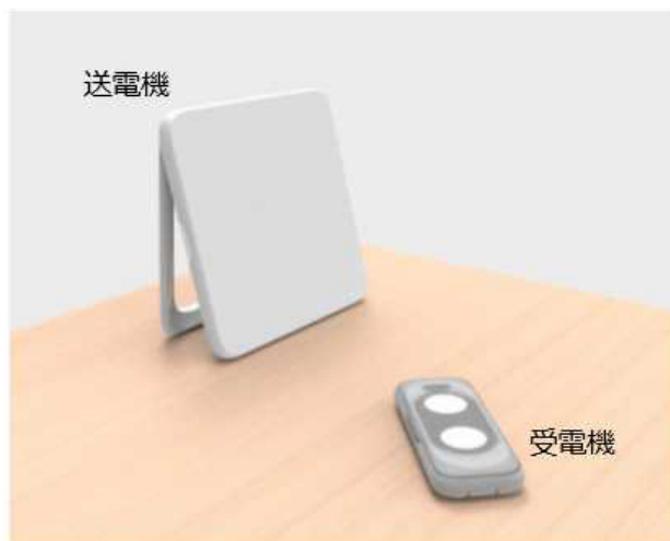
パナソニックが開発したマイクロ波電力伝送システム Enesphere

今回、パナソニックは、920 MHz帯の電波を活用した送電機と受電機からなるマイクロ波電力伝送システム Enesphere (エネスフィア) を開発し、サンプル提供を開始するとともに、様々な用途・シーンでの試験的活用を進めていきます。