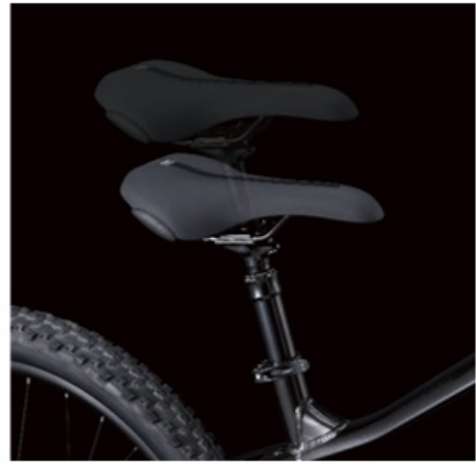
ドロップパーシートポストとサドル

クッション性に優れ、未舗装道路を走行しても疲れにくいSELLE ROYAL製サドルを搭載。