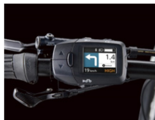
サイド液晶ディスプレイスイッチ

走行速度 / 走行距離 / 平均速度 / 最高速度 積算距離 / バッテリー残量 / 走行可能距離 ケイデンス / アシストパワーインジケータ アシストモード (HIGH/AUTO/OFF)