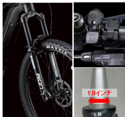
フロントサスペンション

走行時の路面に合わせてサスペンションのロックとリリースを手元で操作できるリモートレバーにより舗装路からオフロードまで幅広く楽しめる。