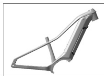
XEALT M5 フレーム