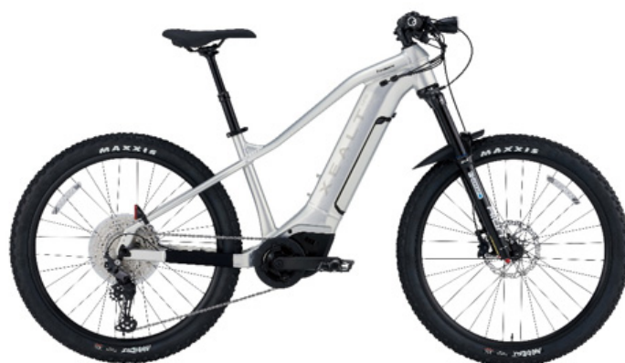
BE-GM142 (スターライトシルバー ※1)