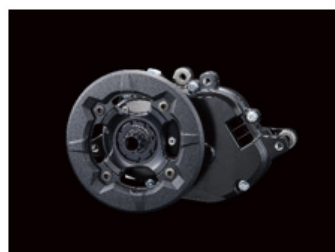
GXドライブユニット