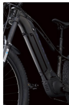
ダウンチューブ一体型バッテリー