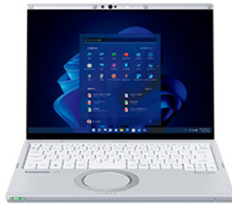
モバイルパソコン Let's note パナソニック株式会社 2022.2 Panasonic Corporation