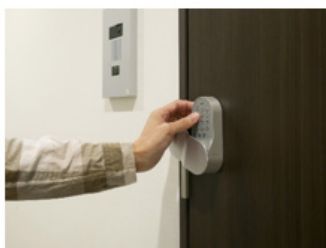
スマートキーによる セルフ内見※2