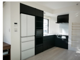
冷蔵庫・オープンレンジ・食器 洗い乾燥機