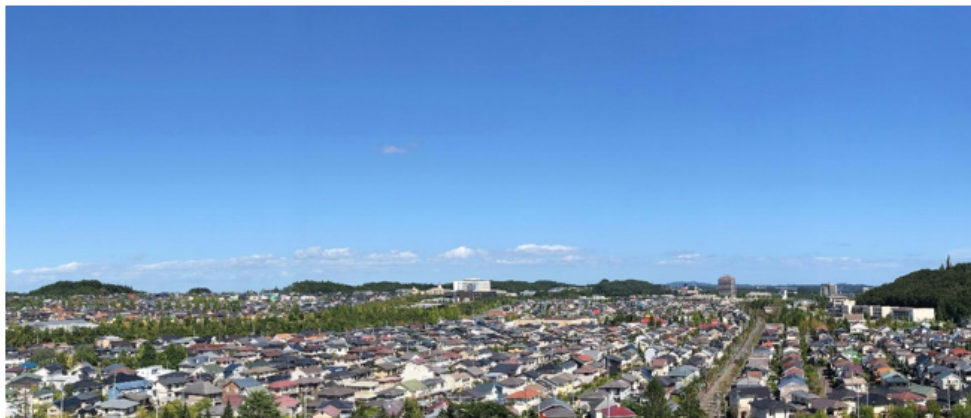
「朝日」から寺岡方面の眺望