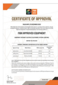
【 FIBAの認証書 】

パナソニック株式会社は、国際バスケットボール連盟 (FIBA: 以降FIBA) との照明器具の認証契約を2021年10月に締結しました。照明器具でのFIBA認証はアジア初※1となります。この契約により、当社の照明器具を設置している体育館 (アリーナ) でFIBA主催の国際大会の開催が可能となり、国内においてのバスケットボール競技の活性化に貢献してまいります。