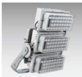
【 LED投光器「アウルビーム」 】