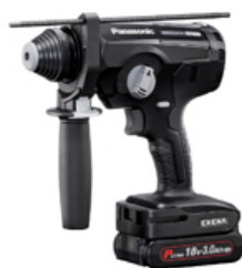
18 V 3.0 Ah 電池セット EZ1HD1N18D-B