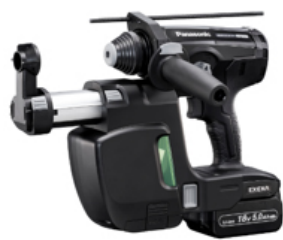
集じんシステム付 18 V 5.0 Ah 電池セット EZ1HD1J18V-B