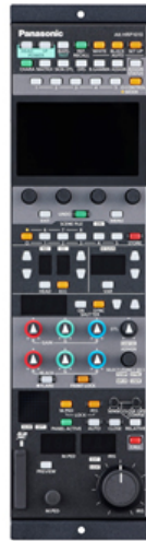
品名:リモートオペレーションパネル(ROP) 品番:AK-HRP1010 パナソニック株式会社 2021年10月