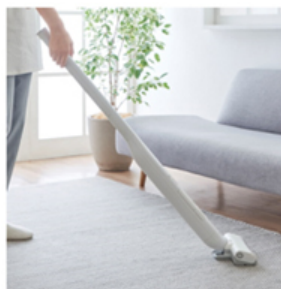
本体重量約1.5 kg 手元重量約0.45 kg※6