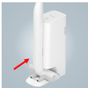
クリーンドックに戻すだけ