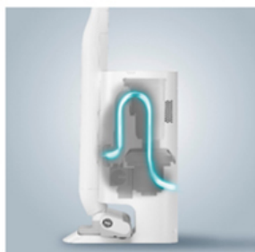
クリーンドックの ゴミ収集イメージ