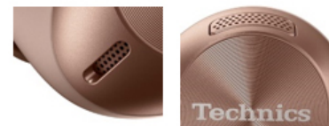
口方向に向けた通話用マイク

周囲の音や発話者の声を拾う2つの通話用マイクには、風切り音低減構造を採用。2か所のマイクの開口部は金属メッシュを配置することで風の入り込む量を制限し、風切り音による不快なノイズの発生を低減します。さらにメッシュ部からマイクの間には2つの空間を設けています。この空間が空気の乱れを抑え、マイクへの風の入り込みを低減し風切り音の発生を抑えます。こうした構造の工夫によって風切り音の発生を抑制することに加え、2つのマイクから入ってくる音を分析し、検知した風切り音を低減します。通話時、音楽や映像の鑑賞時に不快な音に感じやすい風切り音を低減し、快適な使用環境を実現します。