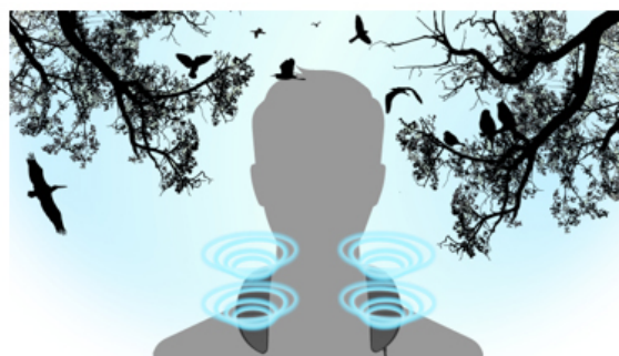
GN01の場合 現実世界と同じように頭の外で音が鳴り、 圧倒的な音の広がりが可能に。