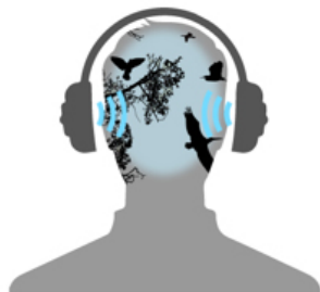
通常のヘッドセット 耳の中に音を届け、頭の中で音が鳴る

首回りの限られた配置の中で、ゲームクリエイターの創造する音空間の意図を再現できる4つのスピーカーを搭載。シアタースピーカーの特性を取り入れた4chスピーカーの配置で、現実世界と同じように頭の外で音が広がります。