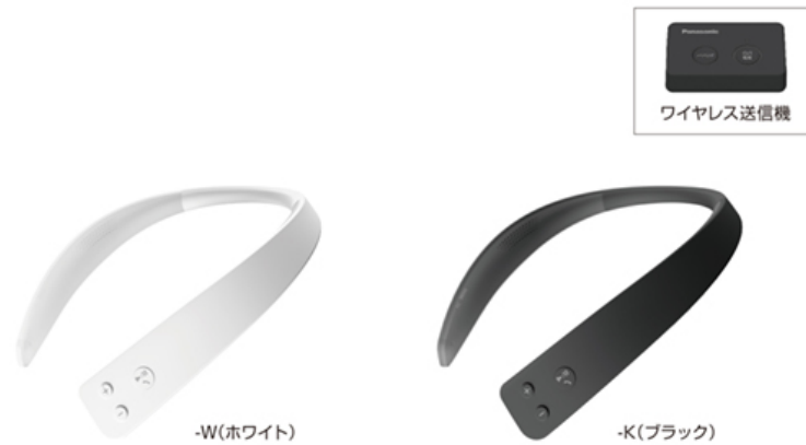
ワイヤレスネックスピーカー「SC-WN10」 (2021年8月 パナソニック)