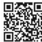
【iOS版ダウンロード QRコード】

https://apps.apple.com/jp/app/id1530129634