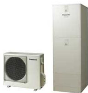
【ヒートポンプユニット、貯湯ユニット】