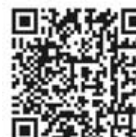
【Android版ダウンロード QRコード】

https://play.google.com/store/apps/details? id=com.panasonic.DomesticHotWater&hl=ja