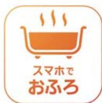
【「スマホでお風呂」アプリ】