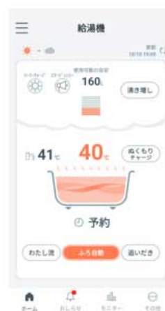
【「スマホでお風呂」アプリトップ画面 (イメージ)】

パナソニック株式会社 ライフソリューションズ社は、エコキュート専用スマートフォンアプリ「スマホでお風呂(※2)」を、さらに便利で一人ひとりに合わせた快適入浴機能を拡充するために2021年10月にアップデートします。