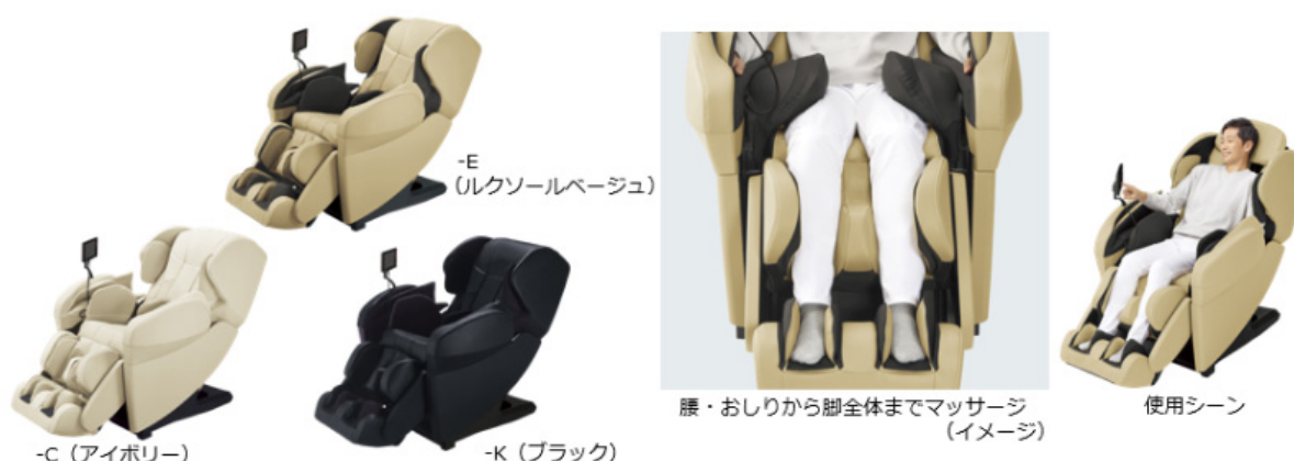
パナソニック「リアルプロ」EP-MA102 2021年6月