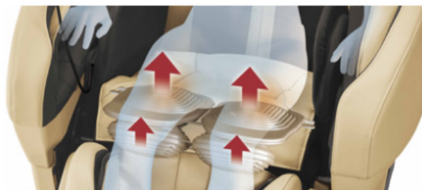
太もも裏をエアの力でグイッと押し上げ、ほぐす。