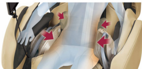
太ももから骨盤まわりまで幅広い範囲を圧迫。

また、太もも上部から下半身のホールド感を向上したことにより、腰が逃げにくくなり、モミ玉が腰・背中のコリの深部までしっかり届くようになりました。