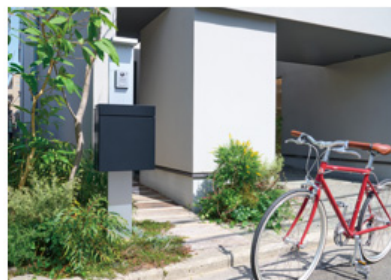
【施工イメージ (門扉に壁掛け施工・外壁に壁掛け施工・ポールに設置)】