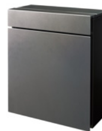
【小包ポスト「Pakemo (パケモ)」】