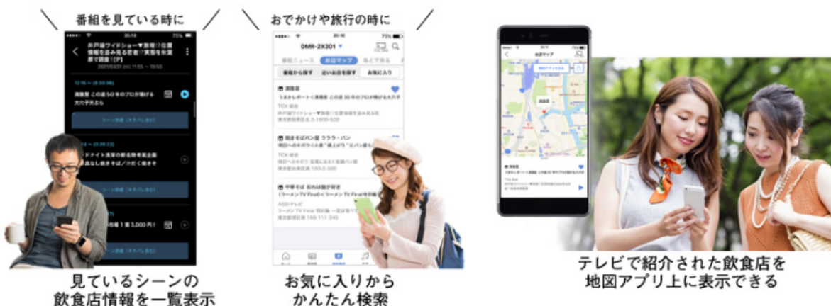
見ているシーンの 飲食店情報を一覧表示