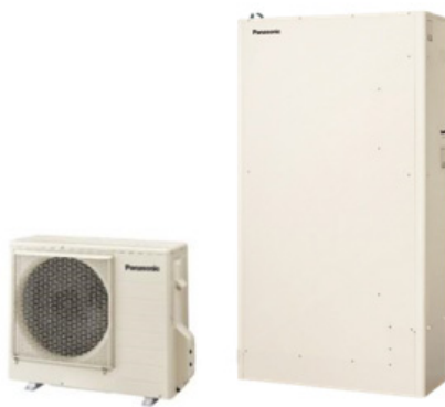
【ヒートポンプユニット、貯湯ユニット】