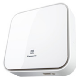
【PM2.5給気ファン壁取付タイプ】

パナソニック株式会社 ライフソリューションズ社は、2021年度よりタイにおいて、ニューノーマル時代に向けた、新規事業を加速させていきます。主な施策は、住宅設備機器のラインアップ拡充、空質事業の強化、共創パートナーとのモジュール建築住宅事業への参入です。