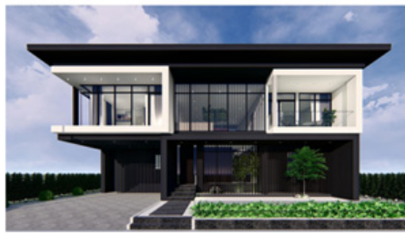
【モジュール建築住宅】