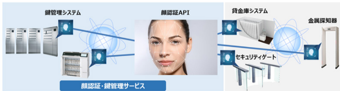
顔認証&フィジカルセキュリティでサービス事業を共創

両社はこれまでセキュリティ関連の販売パートナーとしてネットワークカメラやセキュリティゲートとの連携を推進してまいりましたが、今後は顔認証・鍵管理サービスの事業化を契機に両社のもつ製品群との連携をより一層強化し、共創によって企業のお客様へ安全性・利便性を提供し、ビジネスの成長をサポートしてまいります。