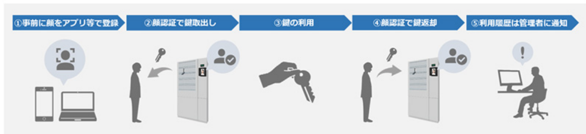
顔認証・鍵管理サービス 利用イメージ

クマヒラはこのような鍵の管理において鍵管理機を用いた「鍵管理システム」として提供することで自動化していますが、本人照合時間の短縮化および本人確認の厳正化、また「鍵の保管」・「利用者の制限」・「履歴の記録」といった管理の無人化が喫緊の課題となっています。一方、パナソニックはICカードレス入退室などの現場において世界最高水準※1の顔認証技術を提供しており、今回、外部サービス(システム)との連携を可能にする「顔認証APIサービス」を活用し、クマヒラと共同で新たなサービスの事業化に向けて開発、製造、販売することで、これまで提供が困難な現場においても非接触かつストレスフリーな顔認証の利用を実現します。