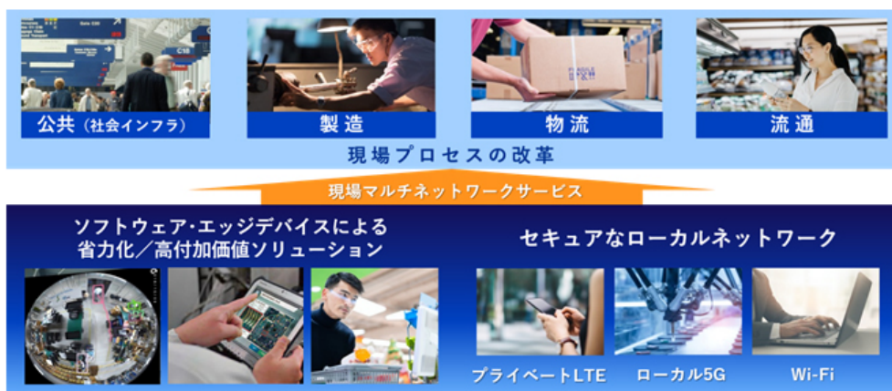
現場マルチネットワークサービスのイメージ図