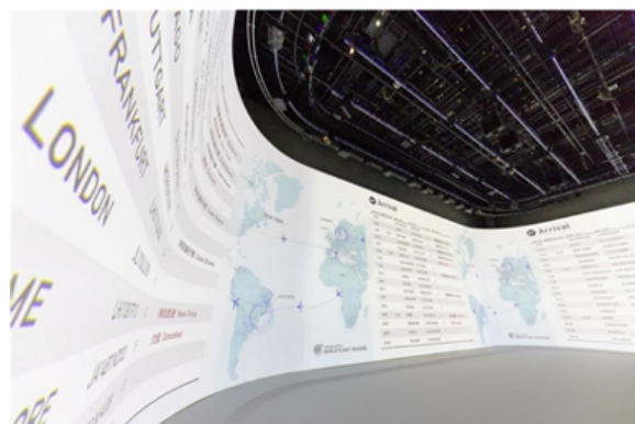
複数プロジェクターによるサイネージ投影