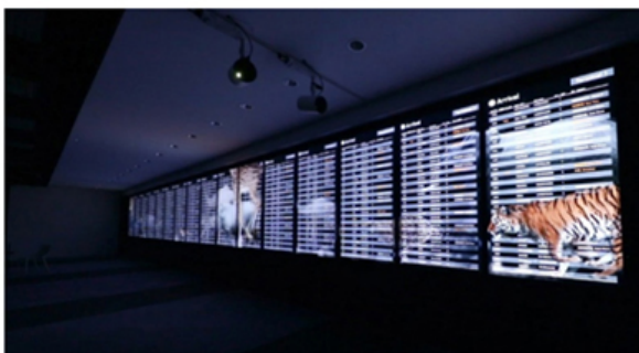
マルチディスプレイへの動画コンテンツ再生

https://biz.panasonic.com/jp-ja/products-services_digitalsignage#controller