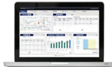
画面操作イメージ