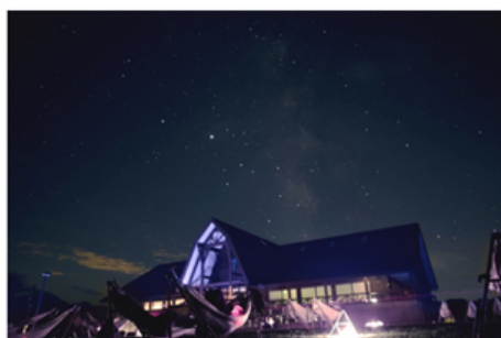
福井県大野市の体験イベント「星空ハンモック」