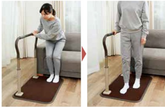
ソファや椅子の近くに設置し、 立ち上がりから歩き出しの サポートも可能