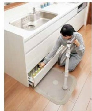
防かび、滑り止め加工で、浴室や脱衣所、キッチンなどに設置可能