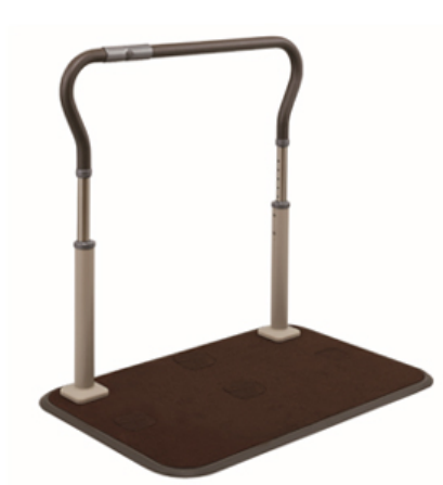
【スムーディ 屋内用単品】