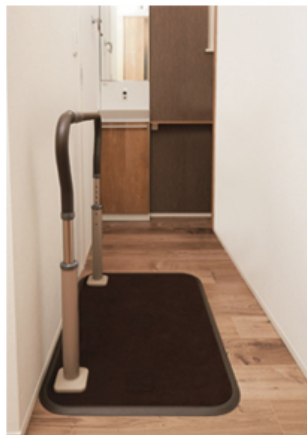
【廊下設置イメージ】