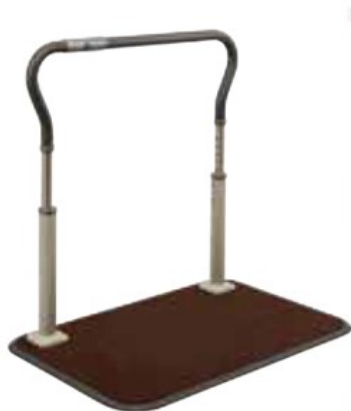
手すり部分をベースの端に配置することで 廊下のスペースを確保

歩行サポート手すり「スムーディ 屋内用」は凹凸が少ない手すり部分により、端から端まで握りやすく、廊下でのつたい歩きに適しています。安定感と廊下への設置のしやすさを両立した幅60 cmのベースを採用しており、両足をしっかりと乗せて歩行ができ、安定した移動が可能です。また、手すり部分の端を座った姿勢からでもつかみやすい形状にすることで、立ち上がりから歩きだまでの重心が不安定になる一連の動作をサポートできます。さらに、手すりの高さを最大で85 cmまで調整可能なため、比較的身長が大きな方でも安心して利用ができます。