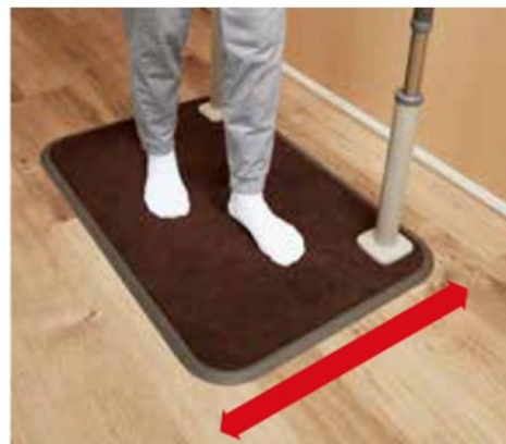
両足を載せることができる 幅60 cmのベースで 安定した歩行が可能