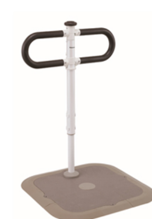
【ツインディ 水廻り用単品】