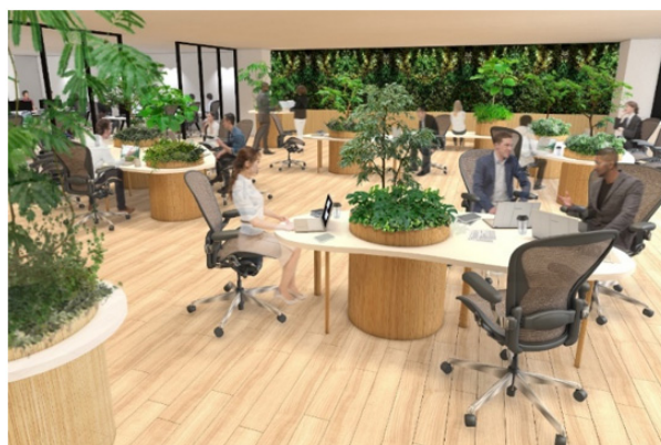
オリジナルビルトインプランターを導入した 職場環境のイメージ

<デザインコンセプト>—自然界の法則や現象、特徴を抽象化— 植物の葉のうねりや流れ、朝露の持つ特有の空気感に家具としての形を与え、音と共にデザイン