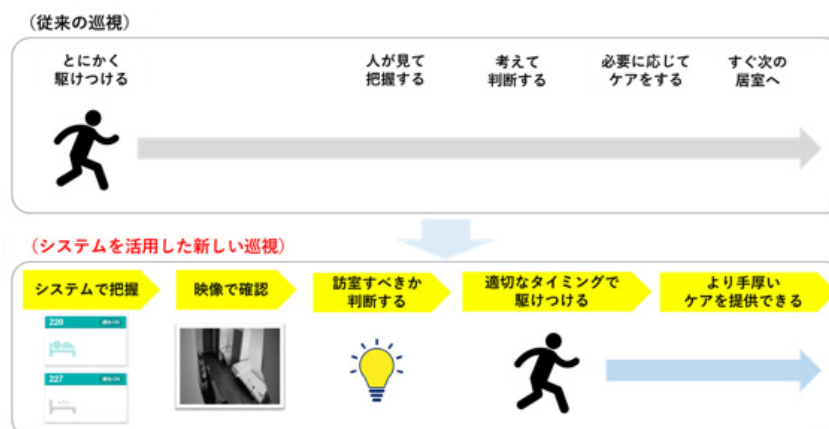
図1* HITOWAにおける夜間巡視オペレーション(イメージ)