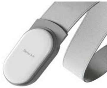
シート型センサー