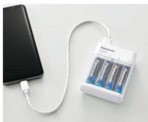
<乾電池使用の場合>