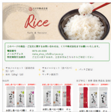
EATPICK marché : くりや株式会社

コミュニティで話題になった「おいしい」「便利」「楽しい」を、実際に購入できます。出店者のこだわりや、そこに込められた想い、ストーリーなども合わせて紹介します。