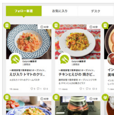
食のタイムライン

新着情報やお気に入りのレシピなどを「食のタイムライン」として一覧で表示。あふれがちな食まわりの情報から、自分の関心や好みにあった情報だけをまとめる手伝いをします。日々の食事を記録に残せる食のパーソナルカレンダー「何食べたっけ?」は食生活を見直すきっかけになるほか、今まで気づかなかった自分が見つかります。