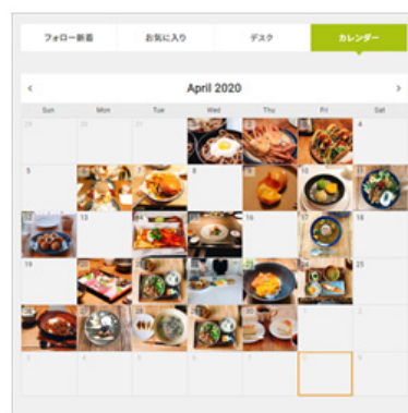
食のパーソナルカレンダー「なに食べたっけ?」