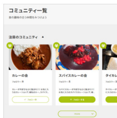
食のコミュニティ

「おいしい」「便利」「めずらしい」など、さまざまな視点で食を取り上げます。新たなコミュニティの立ち上げリクエストも可能です。