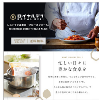
EATPICK marché : ロイヤルデリ