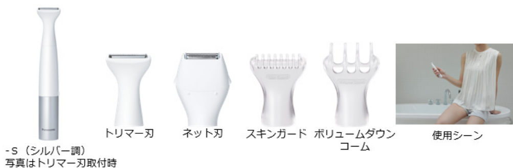
「VIOフェリエ」 ES-WV60 (2020年3月 パナソニック)