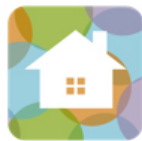
【「スマートHEMSサービスアプリ」】