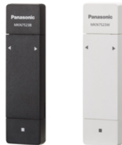
【窓センサー送信器（施錠検知機能付）】