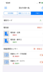
【画面イメージ【戸締り（窓センサー送信器）】