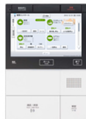
【マンション用インターホン Clouge】