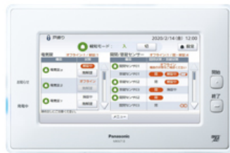
【AiSEG2(7型モニター機能付) (MKN713)】