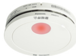
【IoTワイヤレス連動 住宅用火災警報器】