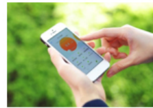
【「スマートHEMSサービスアプリ」使用イメージ】