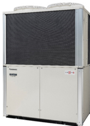
パナソニック ガスヒートポンプエアコン「GHP XAIR (エグゼア) III」 (2020年2月)