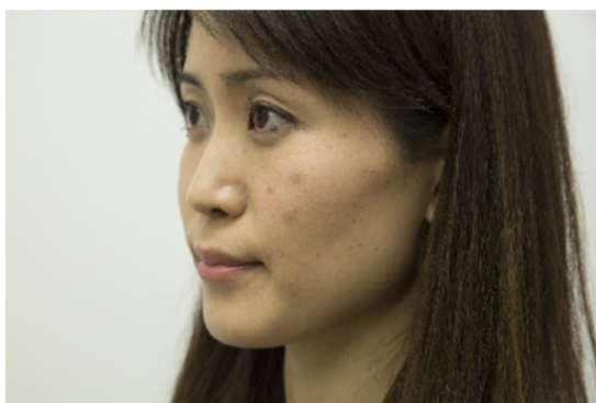
メイクアップシート貼り付け前