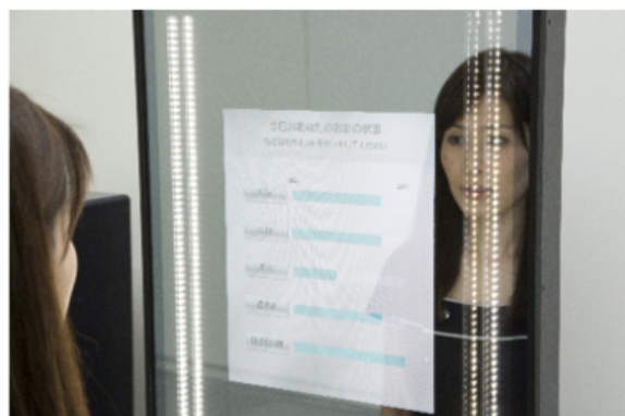
Snow Beauty Mirror (肌5項目の肌測定結果表示)

現在、生活者の価値観やライフスタイルは多様化し、化粧品に求めるニーズ自体が百人百様の時代となっています。一方で、インターネットやSNSの普及などにより情報があふれ、本当に自分にあった化粧品を選ぶことがかえって難しい場合もあります。そのような悩みの解決策のひとつが、デジタル技術とデータを活用した、お一人おひとりに最適な商品とサービスをご紹介するパーソナライズ提案です。