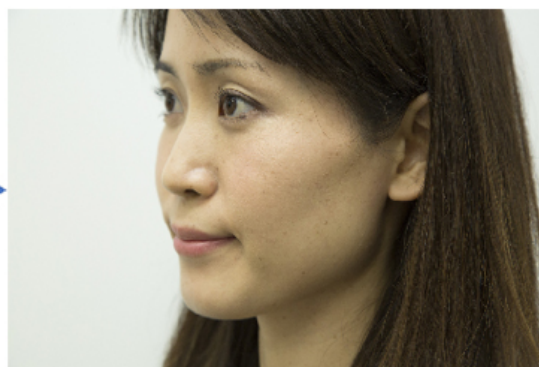
メイクアップシート貼り付け後

パナソニックの最新先端技術とコーセーの化粧品開発力を融合させ、スノービューティーミラーの展開を拡大しながら、美容領域にとどまることなく可能性を追求することで、生活者の多様なニーズにお応えするとともに、QOLの向上などにより社会に貢献していきます。