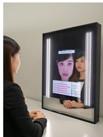
Snow Beauty Mirror (シミ測定)