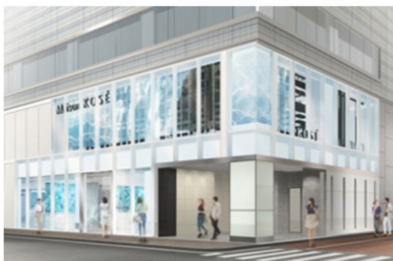
メゾンコーセー 「Maison KOSÉ」外観イメージ

パナソニック株式会社(以下、パナソニック)は、株式会社コーセー(以下、コーセー)と連携し、12月17日にオープンする「Maison KOSÉ(メゾンコーセー)」に、当社が開発している「Snow Beauty Mirror」(以下、スノービューティーミラー)を導入し、共同で実証実験を行います。本取り組みを通し、お客さまの多様なニーズに応える新しいパーソナライズ提案に貢献いたします。