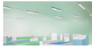
レースウェイ施工イメージ

なお、いずれも天井直付けと、レースウェイの両方に対応しているため(※2)、現場に合わせて施工方法をお選びいただけます。