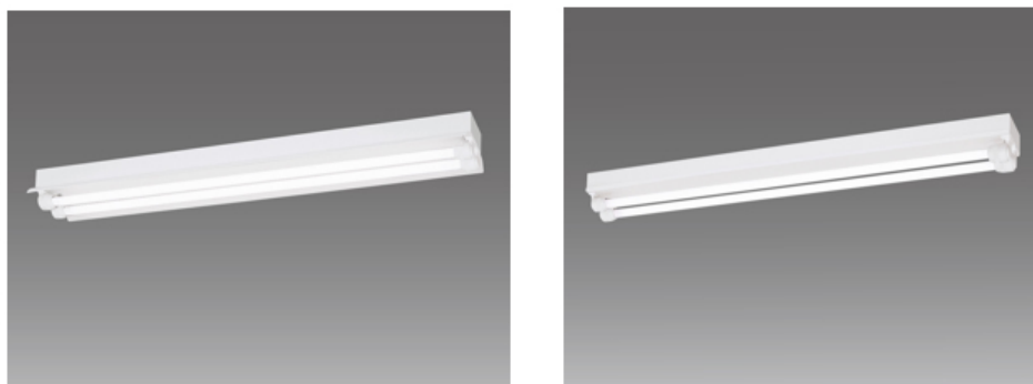
【耐オイルミスト照明器具（左：反射笠付型器具 右：笠なし型器具）】