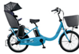
【ギョット・クルームR・DX (BE-ELRD03)】