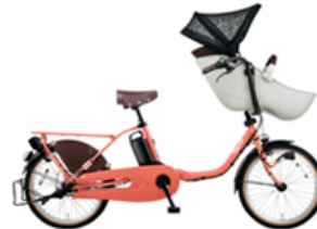
【ギョット・クルームR・EX (BE-ELFE032)】