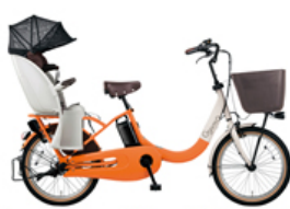
【ギョット・クルームR・EX (BE-ELRE03)】