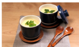
こだわり卵のなめらかな茶碗蒸し