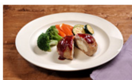
チーズイン生ハンバーグ