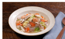
横浜大飯店監修 八宝菜の素

※1:「キッチンポケット」アプリは、Android™ OSバージョン 6.0以上、iOSバージョン 11.0以上のスマートフォンでご利用できます。(2019年8月現在)ただし、すべてのスマートフォンで、アプリの動作に保証を与えるものではありません。また「キッチンポケット」アプリはタブレット端末では見難い場合があります。通信環境や、使用状況によっては、ご利用できない場合があります。