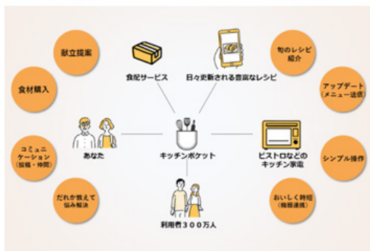
「くらしアップデートサービス」のイメージ

そこで当社は、さまざまなサービスとキッチン家電とを組み合わせ、お客様一人ひとりの食のくらしをサポートする「くらしアップデートサービス」の提供を開始します。これは、プラットフォームアプリ「キッチンポケット」※1を介してお客様とレシピ、キッチン家電をつなぎ、最適メニューの提案や調理サポート、必要な食材の注文・配送など、ライフスタイルに合わせて食のくらしを支援するサービスです。献立の悩み、買い物や調理などにかかる時間・労力を軽減し、楽しい食事や家族の団らんに充てる時間を創出することができます。