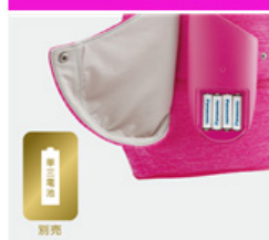
単3形乾電池（別売）で使用