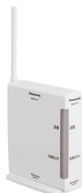
【アドバンスシリーズ用 無線アダプタ】