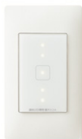
【アドバンスシリーズ リンクモデル タッチLED調光スイッチ】