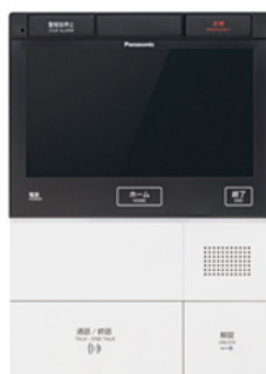
【セキュリティインターホン親機（住戸用）】