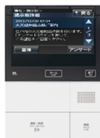
インターホン親機