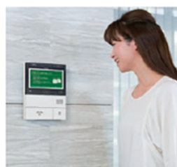
インターホン親機（住戸部）