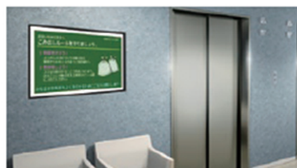
サイネージ（共用部）