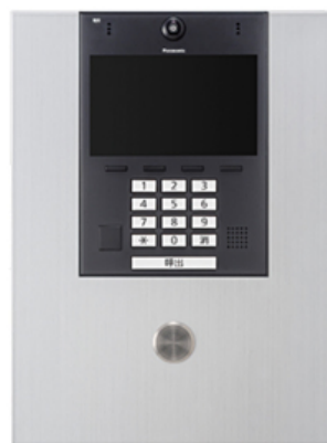
【ロビーインターホン】