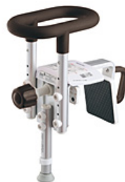
【200脚付きS (ショート) モカブラウン】