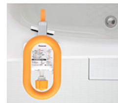
【浴槽の端への設置イメージ】