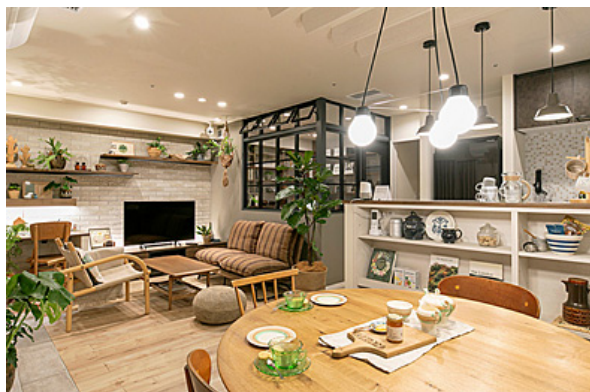
【「家族がほどよくつながる家」プラン】

間取りを変更せずコストを抑えた、家族一人ひとりの居場所とほどよい距離感をつくる「家族がほどよくつながる家」プラン。間取りを大きく変更し大規模リノベーションを実施した、夫婦ふたり暮らしを想定した「趣味を楽しむ、ギャラリーの家」プランの2種類を用意。それぞれ、マンション1戸まるごとリアルサイズで紹介いたします。この2つの原寸大プランを体験することで、リノベーションで実現する可能性の幅を感じることができます。