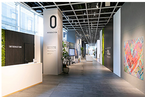
【イントロダクション】