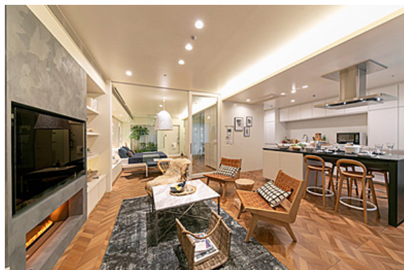
【「趣味を楽しむ、ギャラリーの家」プラン】