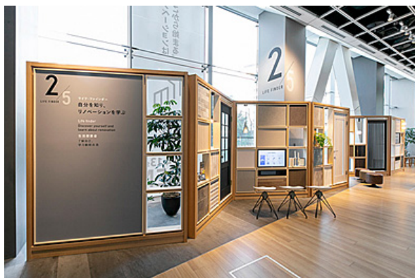
【ライフ・ファインダー】