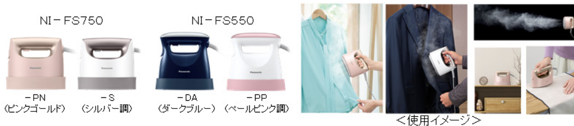
衣類スチーマー (2019年3月 パナソニック)