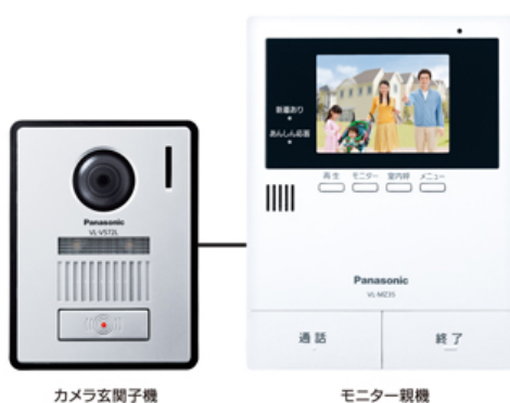
テレビドアホン「VL-SZ35KF」 (2019年3月 パナソニック)