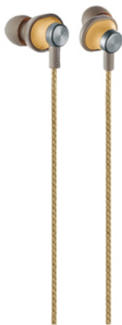
-C キャメルベージュ

ファッションになじみやすいワントーンのユニセックスデザインと4色のカラーバリエーションを採用しました。服装に合わせてやすいほか、身につける楽しさを演出します。また、上質感のあるファブリックケーブルは絡みにくく快適にお使いいただけます。