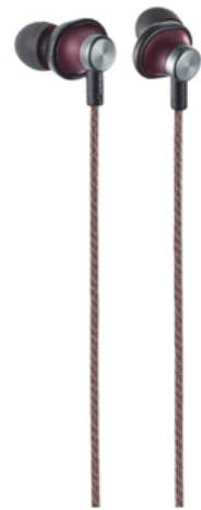
-R バーガンディレッド