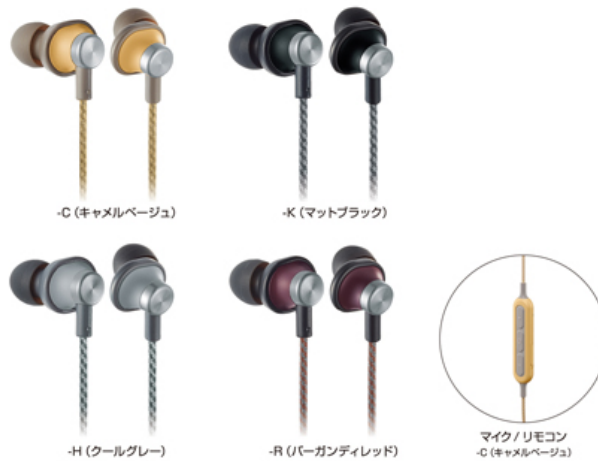
ワイヤレスステレオインサイドホン「RP-HTX20B」 (2019年3月 パナソニック)