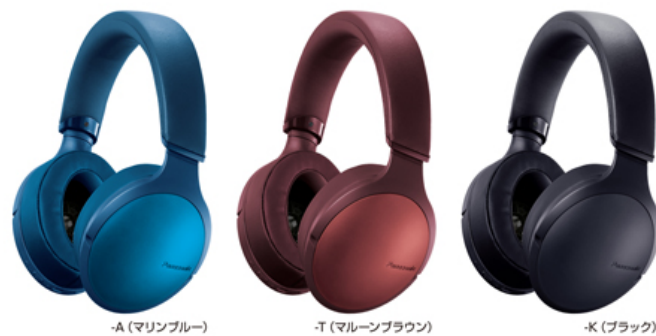
ワイヤレスステレオヘッドホン「RP-HD300B」 (2019年3月 パナソニック)