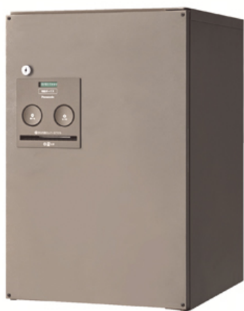
戸建住宅用宅配ボックス COMBOミドルタイプ

※3:推奨品でないコンクリートスライドブロックを使用された場合は、固定裏板および、アンカー固定用金具を正しく取り付けることができない可能性があります。