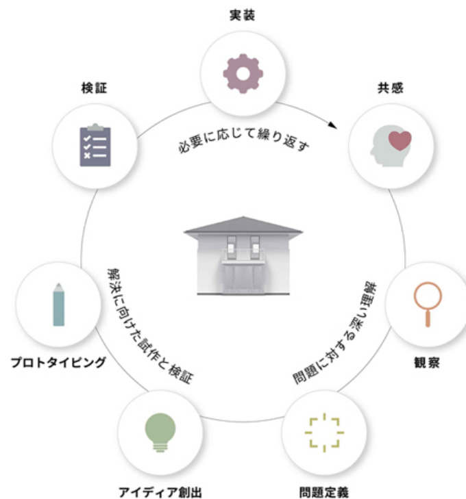
デザインシンキングのプロセスサイクル

当社では、家電から住まいのリフォームまで、日々の会話の中でそれぞれお客様に寄り添い、お困りごとを見つけ、商品の販売だけに留まらないサービスを提供してきました。これは「共感→課題の再定義→プロトタイプ→フィードバック」という共感によるユーザー中心デザインそのものであり、HomeX も家そのものを人間のような共感力を備えるものとして位置づけ、生活シーンや暮らし全体を踏まえた提案をします。